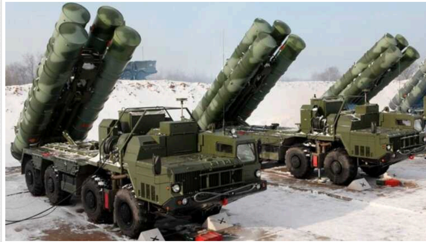
Обстріли України не закінчаться до кінця війни: скільки у ворога ракет С-300 та С-400