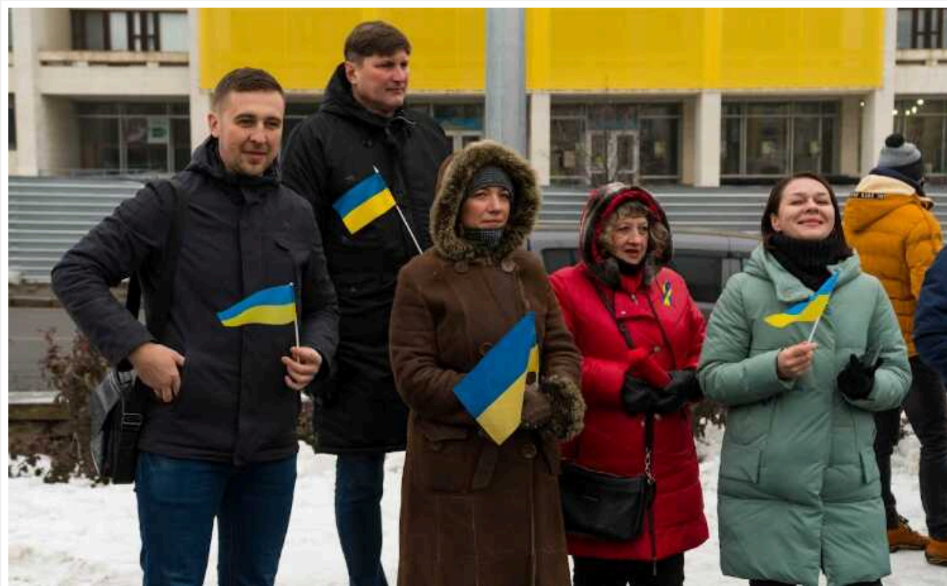
Понад 69% українців вважають, що країна йде до єдності

69% жителів України дотримуються думки, що українці потроху долають суперечності та йдуть шляхом до згуртованої політичної нації.