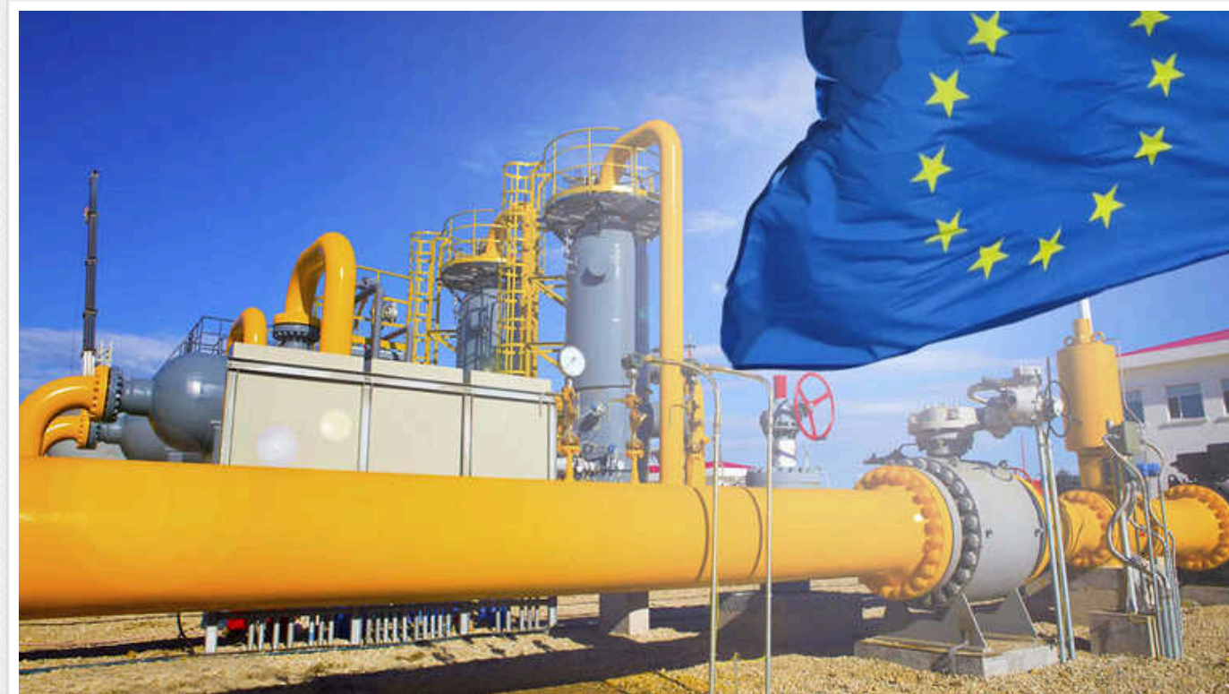
Ціна газу в ЄС впала в 13 разів нижче прогнозу російського "Газпрому"

За тиждень після проходження середини опалювального сезону європейські сховища заповнені на 74,4%, а газ коштує в 13-18 разів дешевше за прогнози, які давали у Росії.