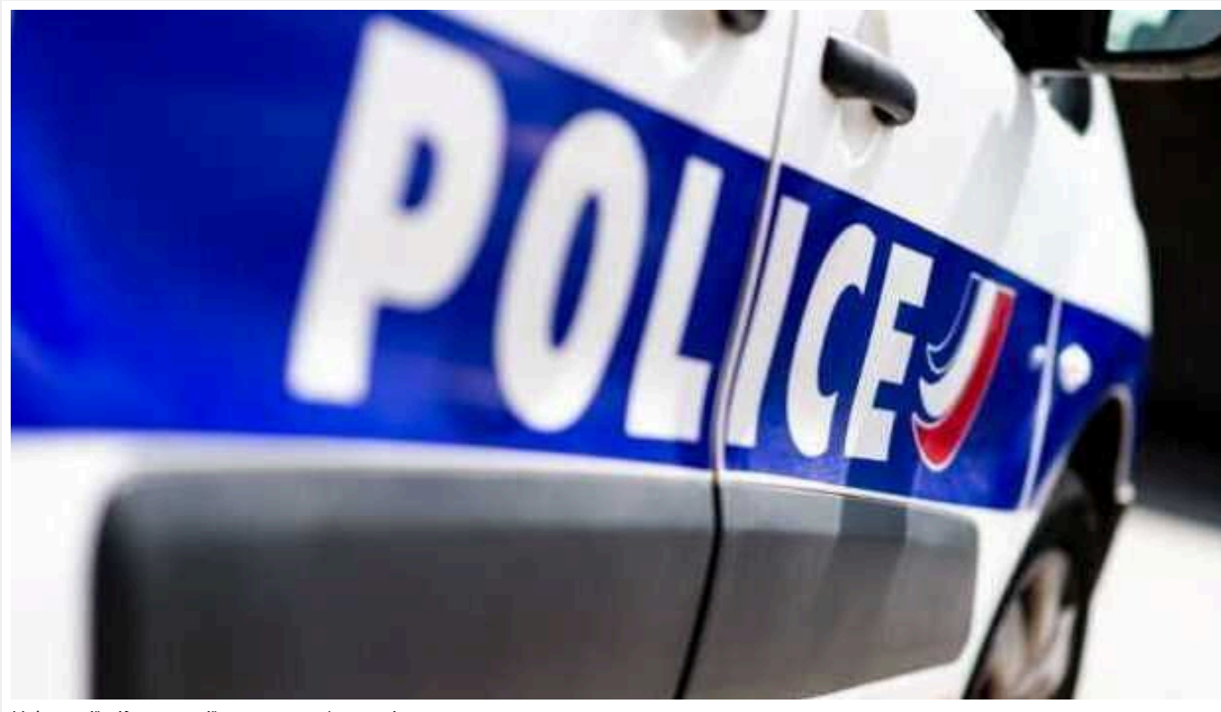
У Франції під час акції протесту фермерів загинула учасниця

У Франції під час блокування аграріями дороги загинула учасниця акції, коли автомобіль протаранив тюки соломи, якими фермери перекрили трасу. Про це повідомляє France info .