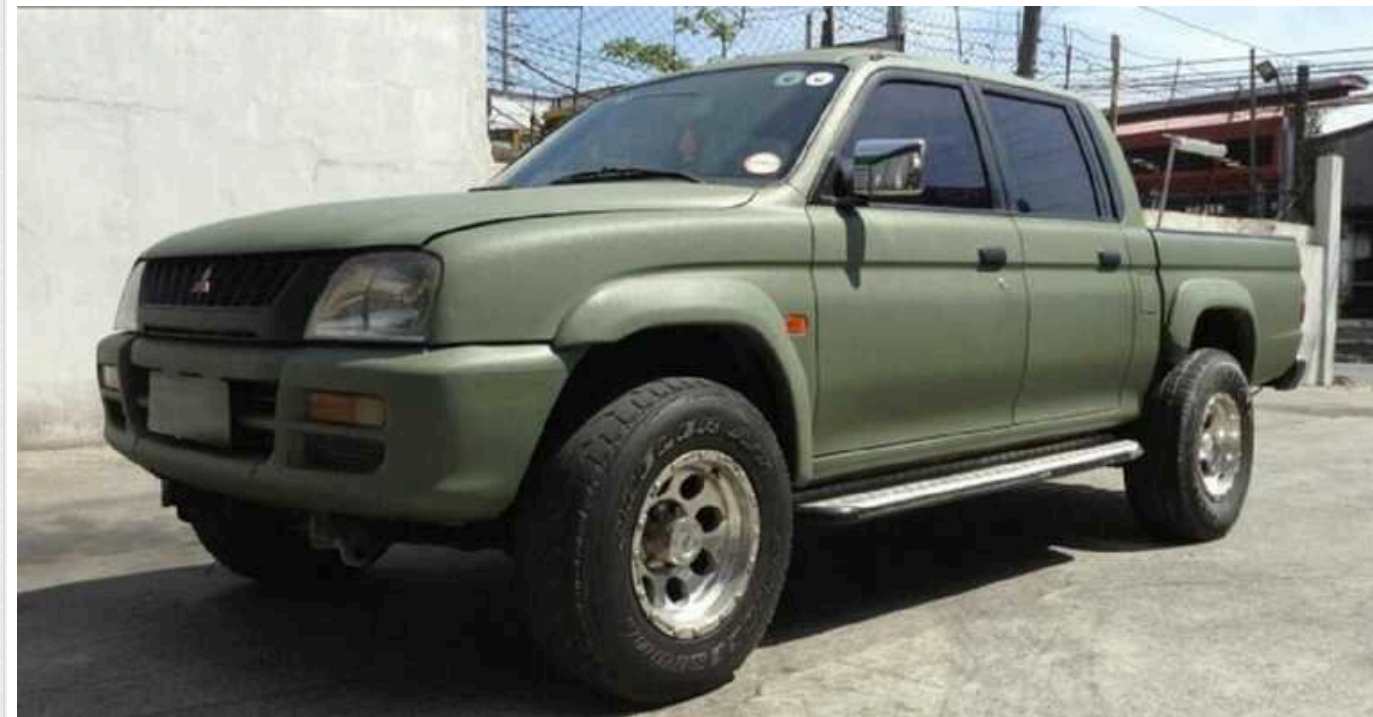
Волонтер з Тернопільщини втратив 300 тисяч гривень при купівлі авто для ЗСУ

Житель Тернопільщини втратив 300 тис. гривень при купівлі автомобіля для Збройних сил України. Чоловік збирав кошти для військових, а потім почав шукати в інтернеті оголошення про продаж автомобіля. На одному із сайтів він помітив авто, яке підходило по параметрах. Під час спілкування у соцмережах з продавцем потерпілий кількома траншами перерахував усі наявні у нього гроші.