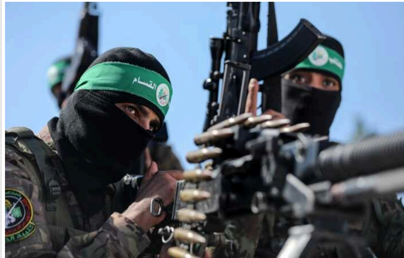
США, Австралія та Британія запровадили нові санкції проти ХАМАС

Велика Британія, США і Австралія запровадили скоординовані санкції проти ХАМАСу, щоб перекрити потік фінансування терористичного урядування.