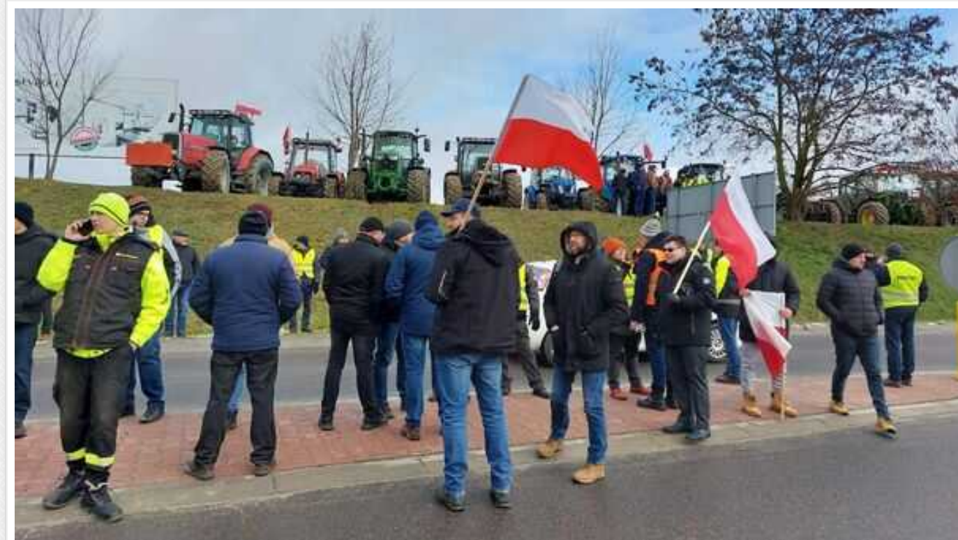
Польща домоглася поступок від Євросоюзу щодо обмеження експорту української агропродукції, - FT

Торговий комісар ЄС Валдіс Домбровскіс заявив виданню Financial Times, що Брюссель блокуватиме імпорт з України, якщо ринок конкретної країни буде переповнений, що створить ризик зниження цін.