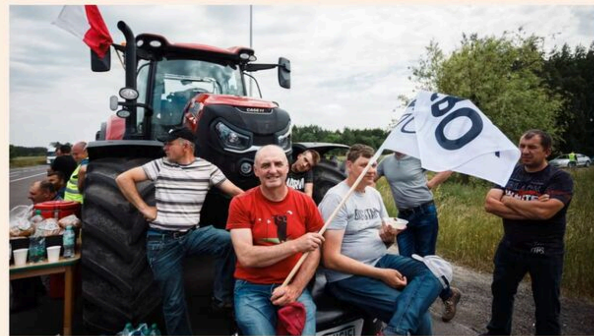
Poland and Hungary introduced unilateral import bans on Ukrainian produce in April 2023, following widespread protests from farmers

Bloc's top trade official says Brussels will look to control influx of farm products in places where they risk depressing prices