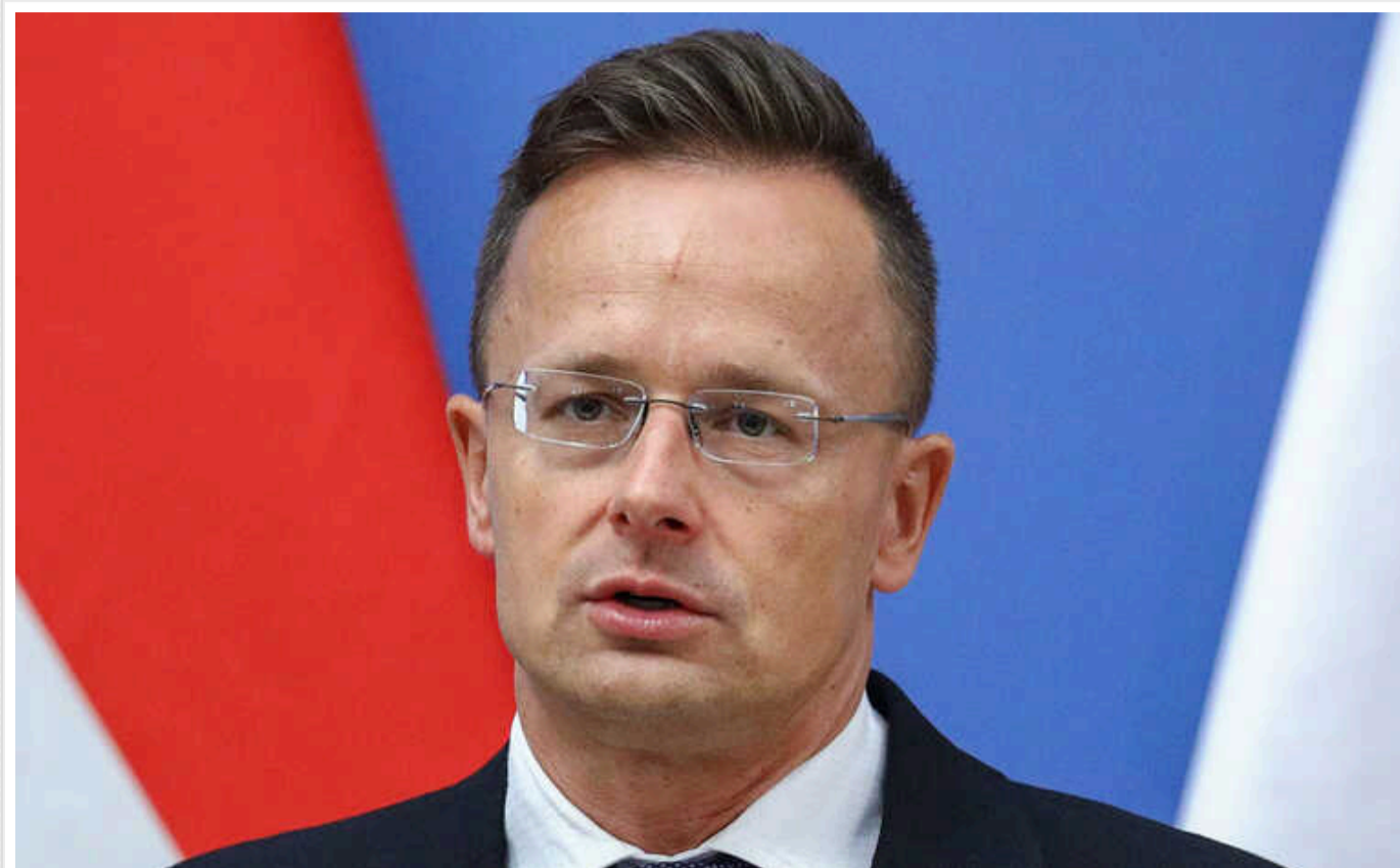
Голові МЗС Угорщини нібито надіслали погрози смертю українською мовою через майбутній візит до Ужгорода: "Бог пробачає, але українці - ні", – Index

Як зазначає видання Index, у листі автор заявив, що українці ненавидять угорську владу за те, що Угорщина "робить усе, щоб Україна програла у війні", і каже, що на Сіярто 29 січня чекає "вибуховий прийом" і рекомендує починати "приготування до похорону".