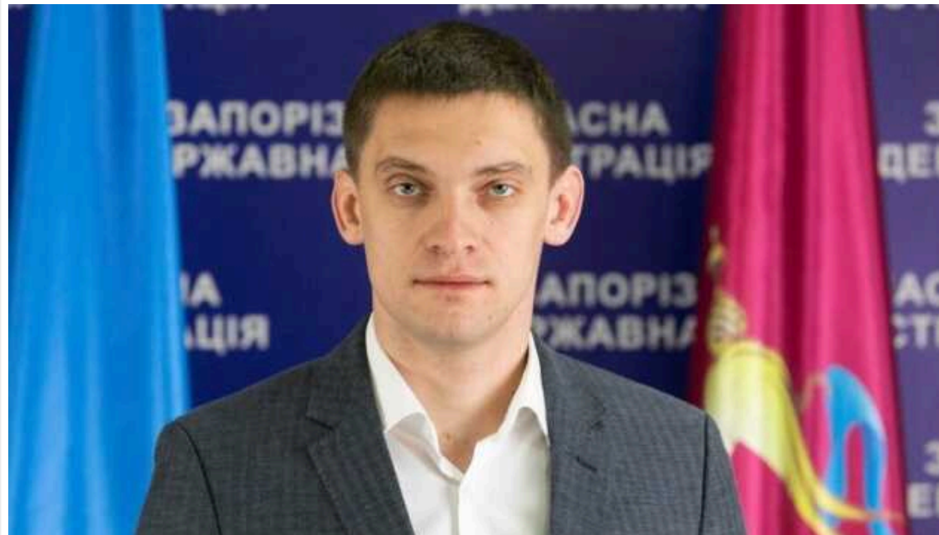
Кабінет міністрів погодив призначення мера Мелітополя Федорова на посаду голови Запорізької ОВА

Кабінет міністрів України погодив призначення мера Мелітополя Івана Федорова на посаду голови Запорізької обласної військової адміністрації.