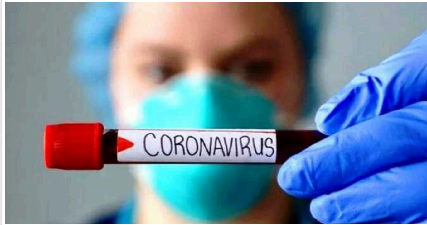
В Україні у січні зареєстровано 9 випадків зараження новим видом коронавірусу "Дженні", - МОЗ

Це субваріант "Омікрона", вперше виявлений у США у вересні 2023 р. Його особливістю ВООЗ назвала швидке поширення.