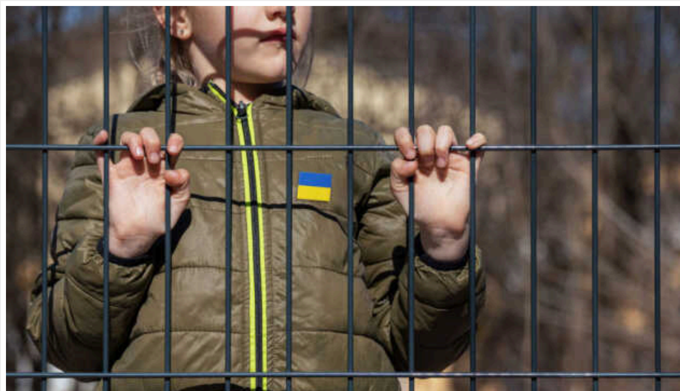
ООН вимагатиме від РФ пояснень щодо депортованих українських дітей

Комітет ООН з прав дитини вимагатиме від Москви пояснень щодо долі українських дітей, насильно депортованих до Росії або на окуповані нею території після початку повномасштабного вторгнення.