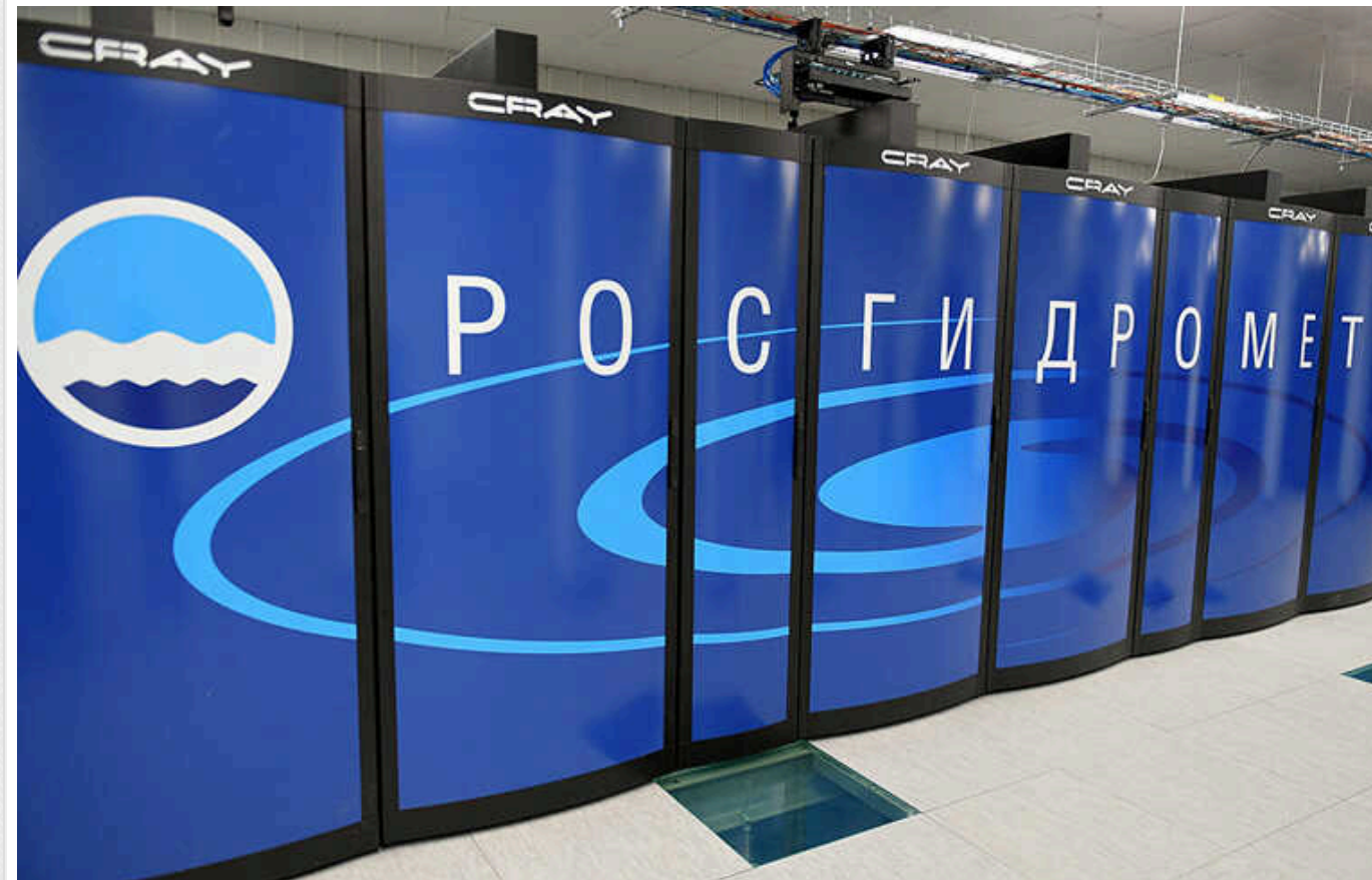
Хакерське угруповання VO Team атакувало російський дослідницький центр космічної гідрометеорології

Хакерське угруповання «VO Team» зламало великий російський дослідницький центр космічної гідрометеорології.