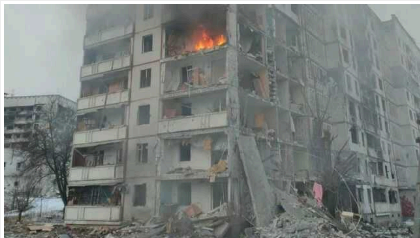
У Харківській ОВА прокоментували ситуацію у місті після ракетного удару окупантів: "Фактично цілого кварталу немає"

Внаслідок ранкового обстрілу Харкова постраждало житло десятків тисяч жителів міста, заявив глава ОВА Синьгубов.