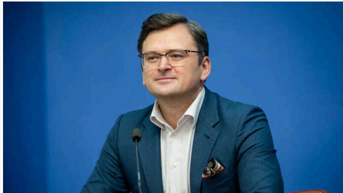
Кулеба разом із главою МЗС Кенії обговорили Формулу миру та подальшу співпрацю

Україна високо цінує участь представника Кенії у зустрічі щодо імплементації Формули миру в Давосі і розраховує на подальшу залученість до цього процесу.