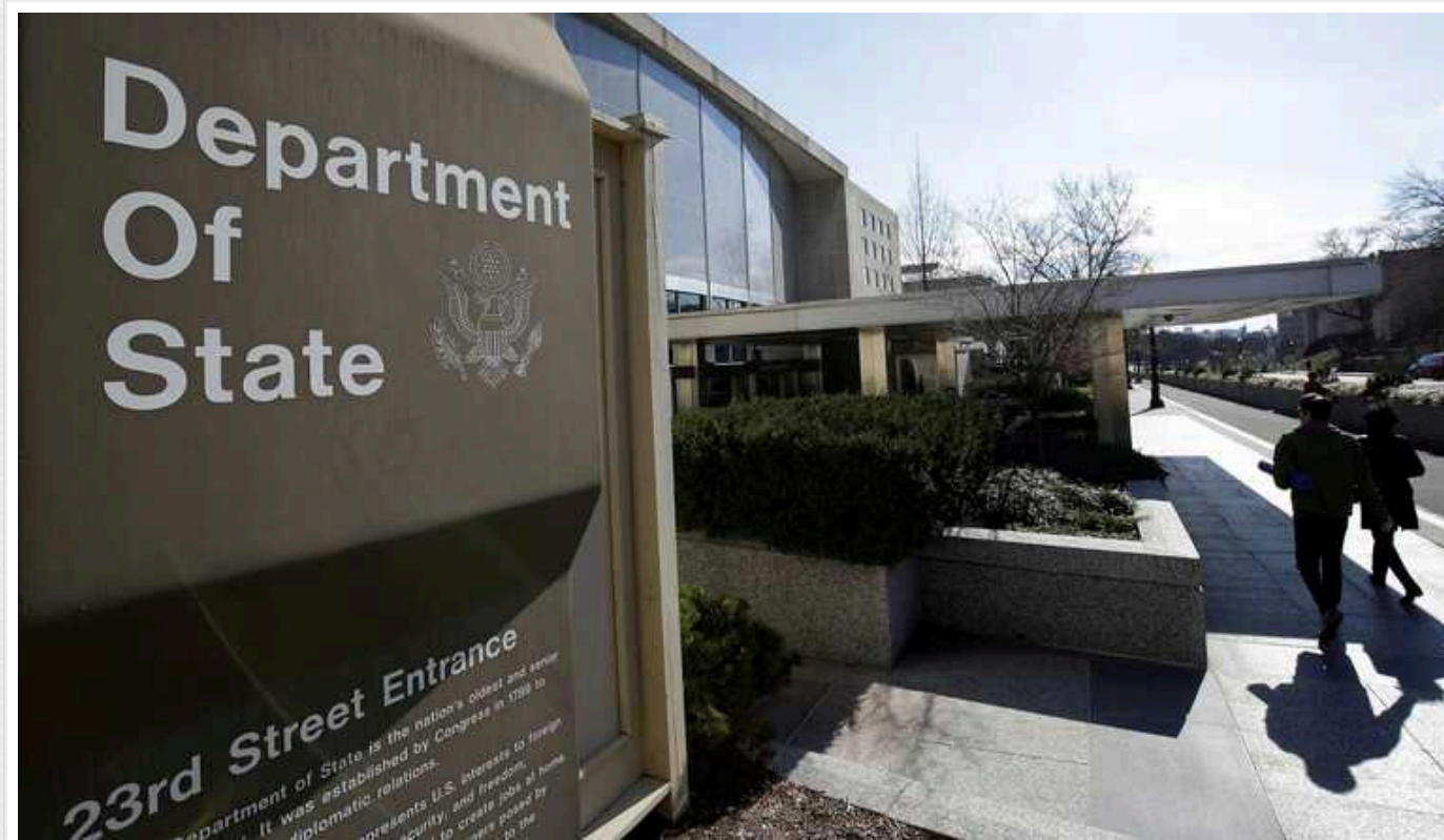
Держдеп США привітав рішення Польщі надати нову допомогу Україні

Державний департамент Сполучених Штатів прокоментував рішення Польщі передати Україні новий оборонний пакет допомоги.