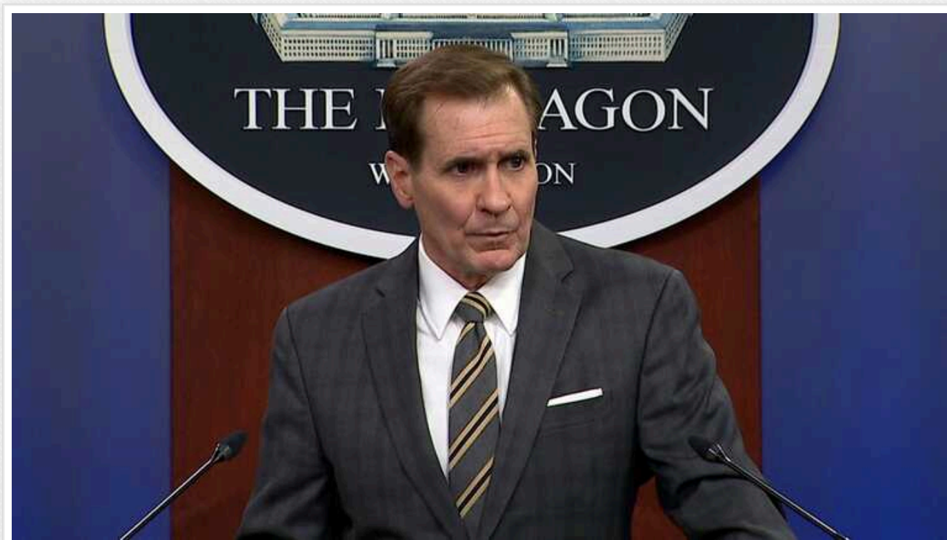
Кірбі: Для України наступні кілька місяців будуть критичними

Перебіг бойових дій в Україні впродовж кількох наступних місяців матиме критичне значення для її захисту.