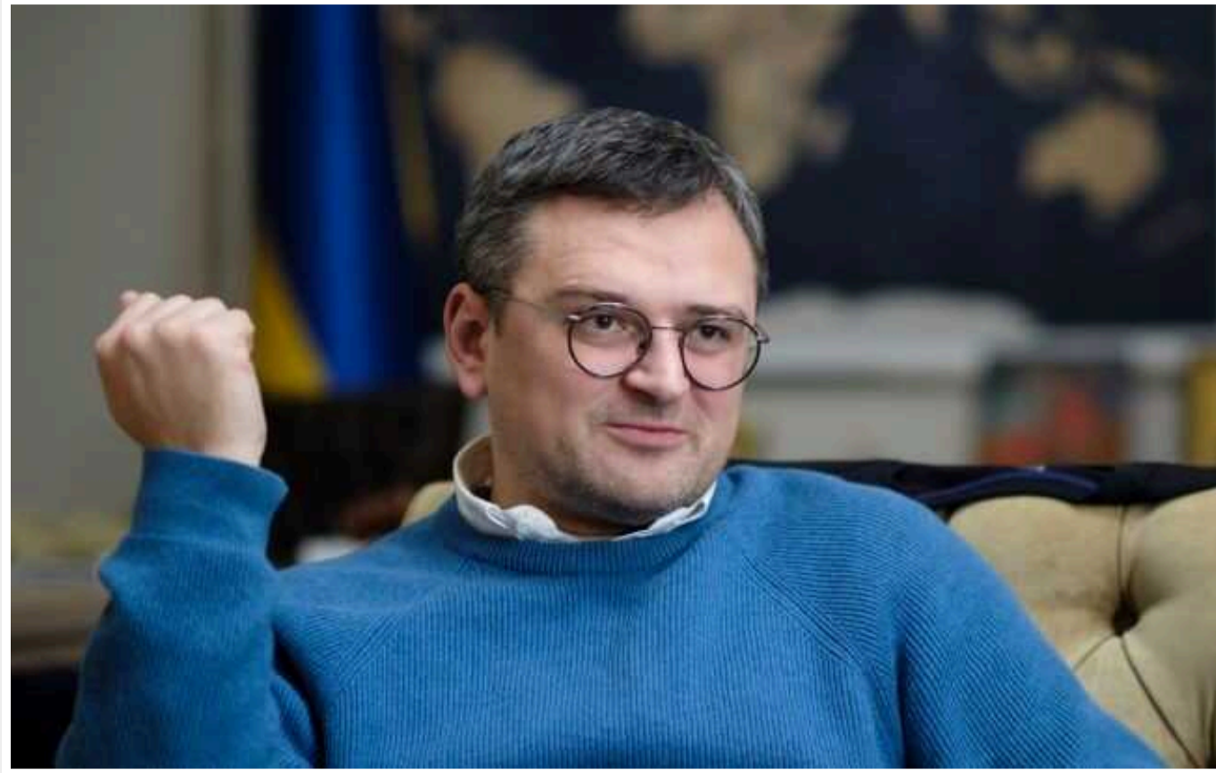
Кулеба: Множинне громадянство не даватиме змоги чоловікам виїхати за кордон під час воєнного стану

Множинне громадянство не даватиме змоги військовозобов'язаним виїхати за кордон під час воєнного стану.