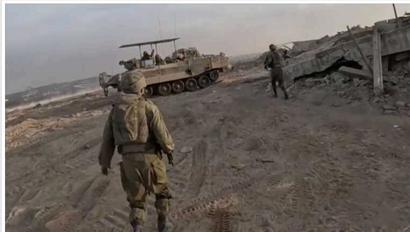
21 ізраїльський солдат загинув в результаті обвалення будівель в Секторі Гази

Внаслідок обвалення будівель у Секторі Гази загинув 21 ізраїльський солдат.