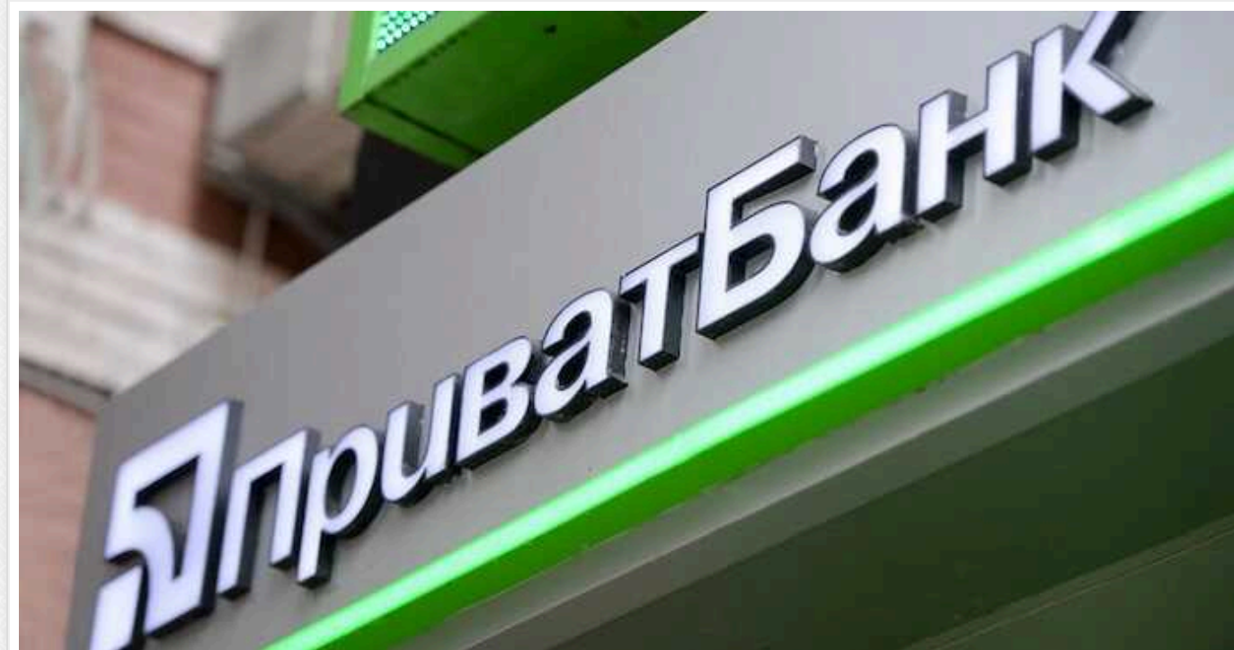
"ПриватБанк" відзвітував про зв'язки з контрагентами з Росії, Білорусії, Сирії та Ірану

"ПриватБанк" проінформував в системі SMIDA про наявність у нього ділових відносин з контрагентами/клієнтами держави зони ризику або контрагентами/клієнтами, які контролюються державою зони ризику.