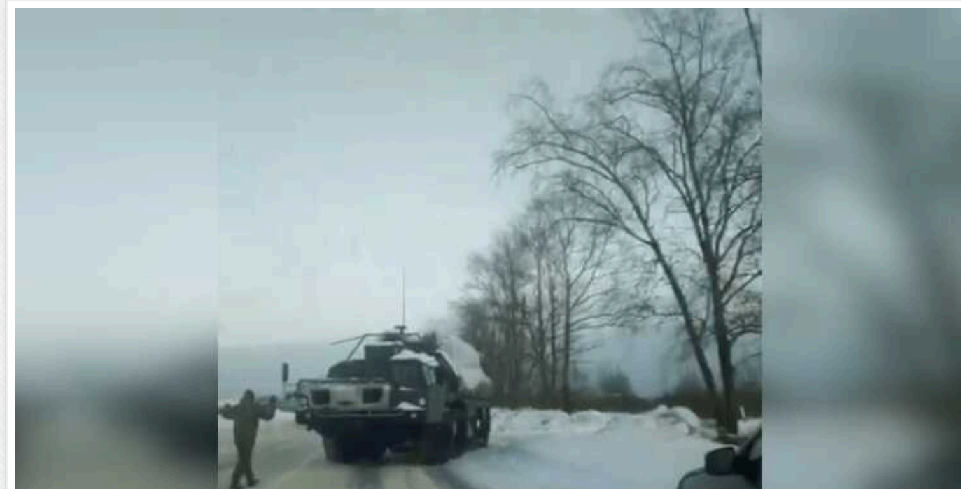
"Готуємося до найгіршого": навколо Петербурга ставлять зенітно-ракетні комплекси С-300, — росЗМІ

За даними російських журналістів, комплекси розгортають після серії вдалих атак на портіві термінали в Ленінградській області. На думку місцевих жителів, на них чекають важкі часи.