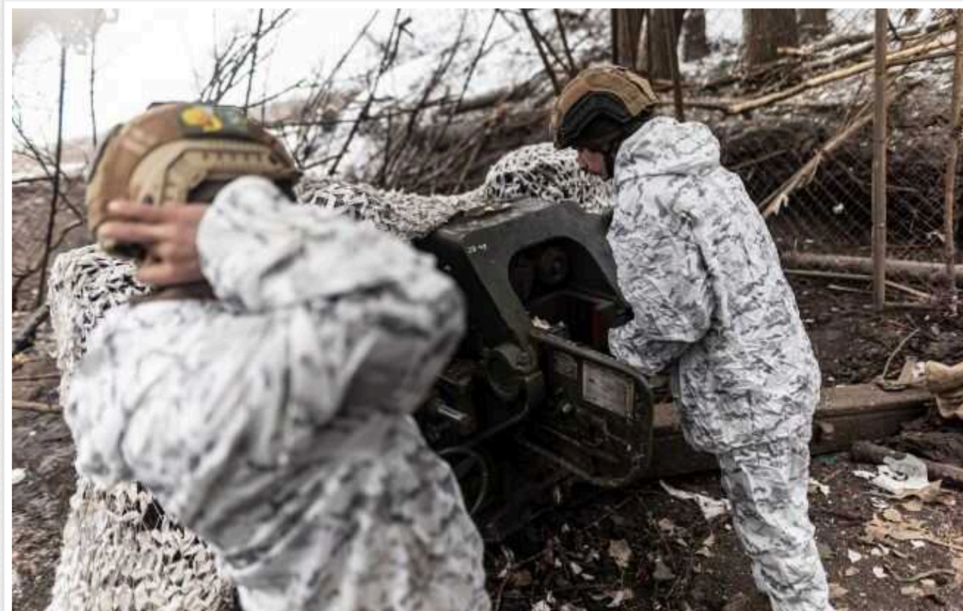
Генштаб: на фронті мінус 960 окупантів та майже 150 одиниць техніки

Втрати Росії у війні в Україні на ранок вівторка, 23 січня, становили 960 окупантів, загальна кількість втрат російської армії з початку вторгнення досягла майже 378 тис. військовослужбовців. Крім того, ЗСУ знищили 22 танки, 51 артсистему та 59 бойових броньованих машин.