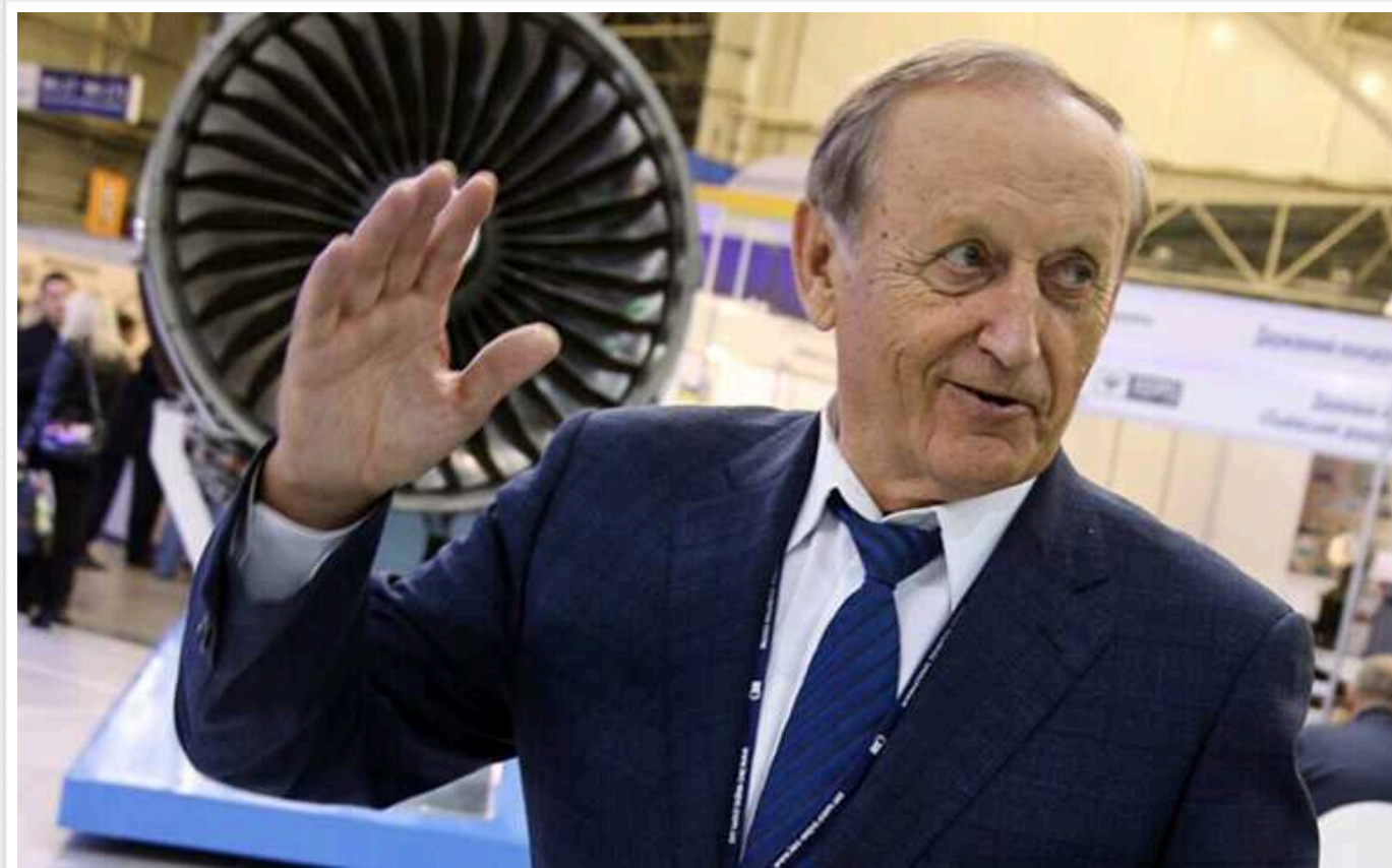
Мінюст подав позов про конфіскацію активів експрезидента АТ "Мотор Січ" Богуслаєва