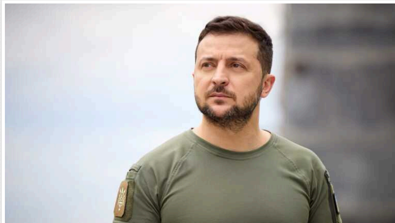
Зеленський про відносини з Польщею: де є складнощі, там будуть спільні перемоги

Президент Володимир Зеленський вважає, що попри наявні труднощі Україна та Польща можуть здобути великі перемоги у питаннях логістики та агропромислового комплексу.