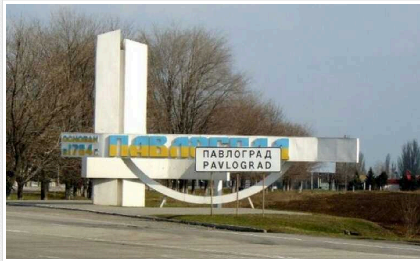
У Павлограді внаслідок ворожої атаки загинула одна людина: є постраждалі

Вранці 23 січня Росія завдала ракетних ударів по Павлограду у Дніпропетровській області. Загинув мирний житель.