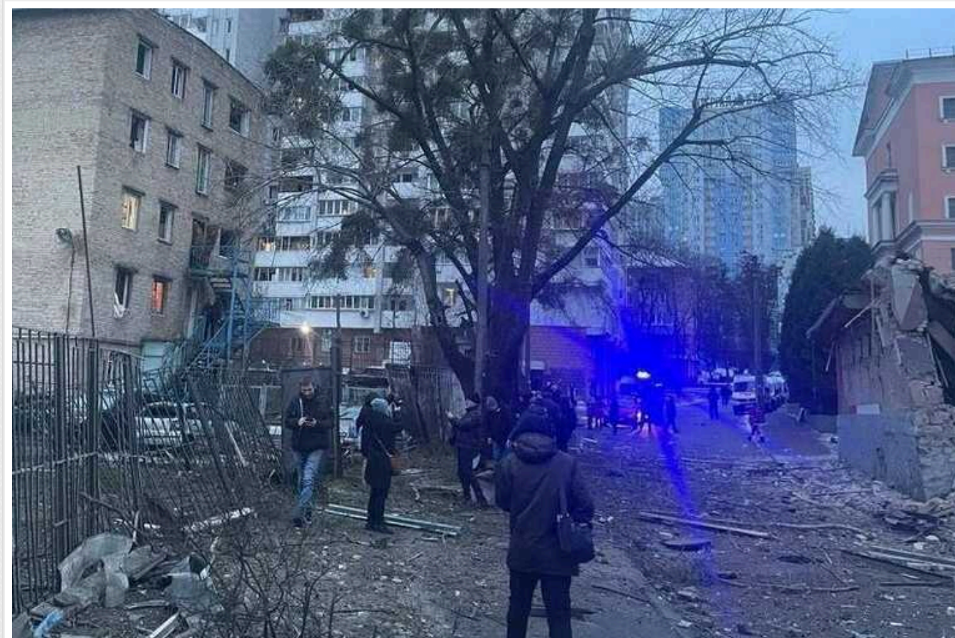
Наслідки російського ракетного удару по Києву: пошкоджені будівлі, є постраждалі та загиблі