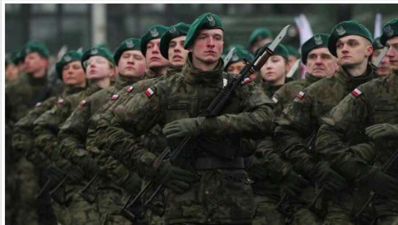
Литва та Польща проведуть військові навчання у вразливій для нападу Росії зоні

Литва та Польща запланували провести цього року спільні військові навчання з метою посилення захисту Сувальського коридору – території, яка одночасно з'єднує територію балтійських країн з Польщею та рештою країн НАТО, а також розділяє Білорусь і Калінінградську область РФ. Навчання можуть відбутися вже у квітні.