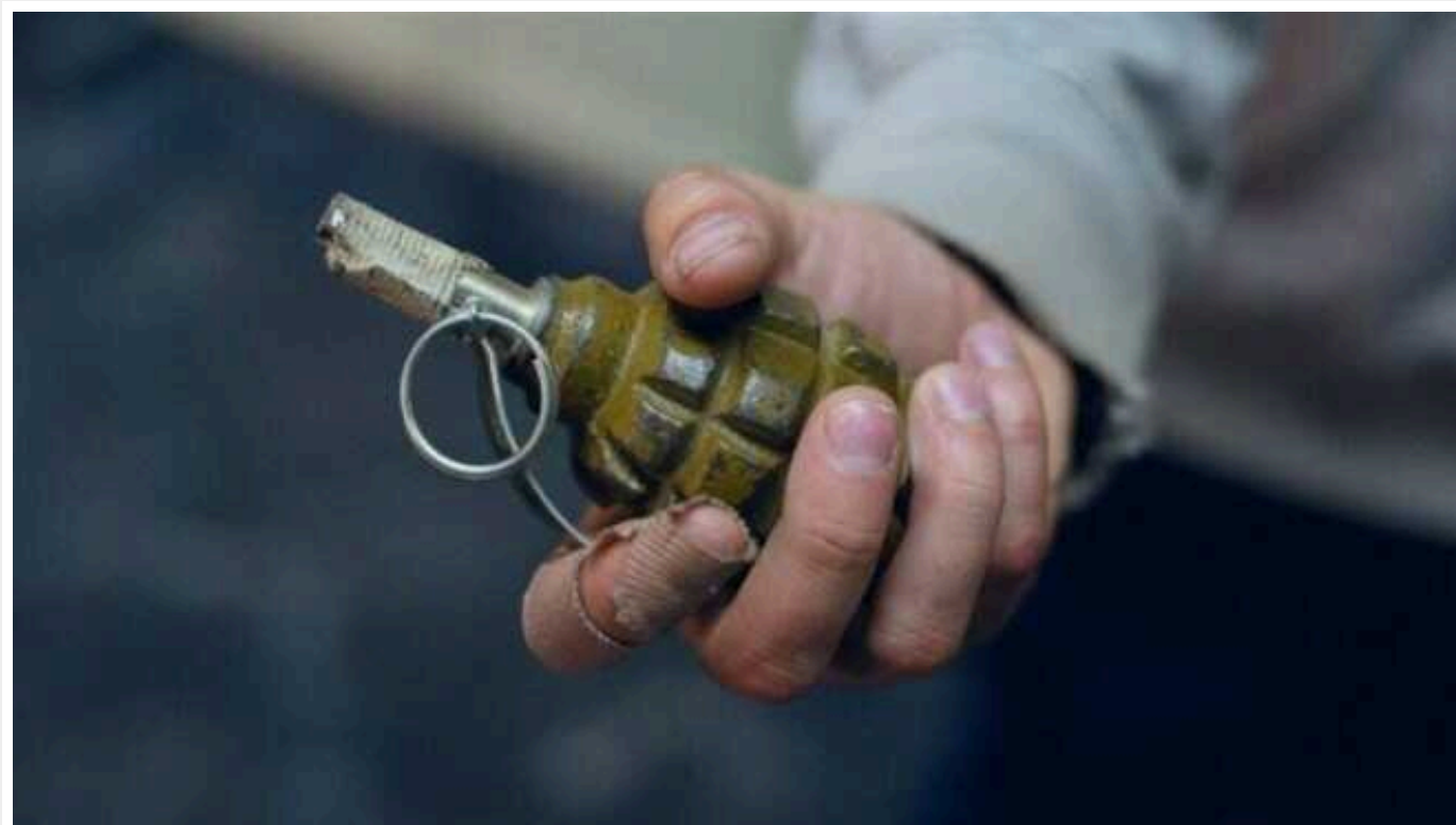
У Харкові чоловік через ревнощі підірвав гранату в магазині

Невідомий чоловік підірвав гранату у приміщенні магазину у Новобаварському районі міста Харків. Інцидент трапився 21 січня.