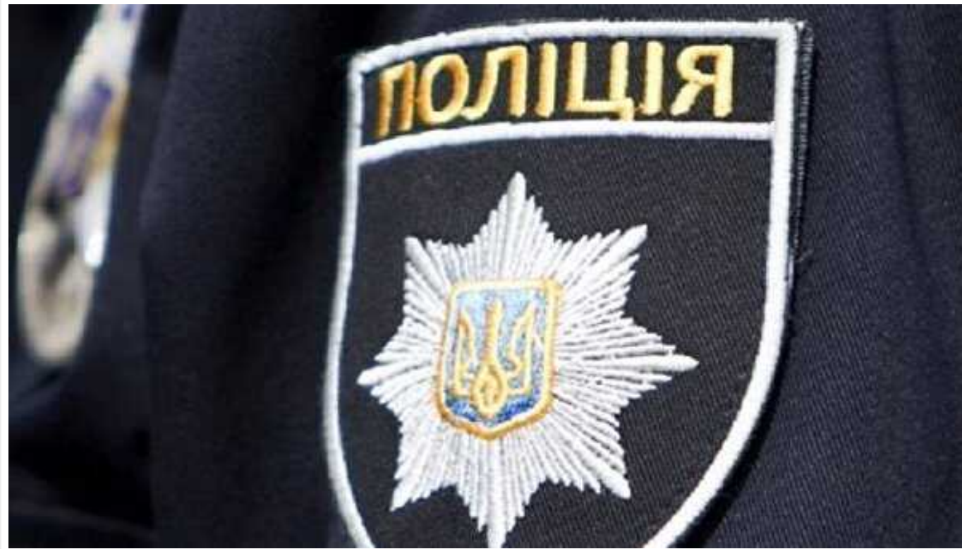
Поліція не забиратиме у громадян отриману ними на початку війни зброю до закінчення бойових дій

Про це заявив голова Нацполіції Іван Вигівський.