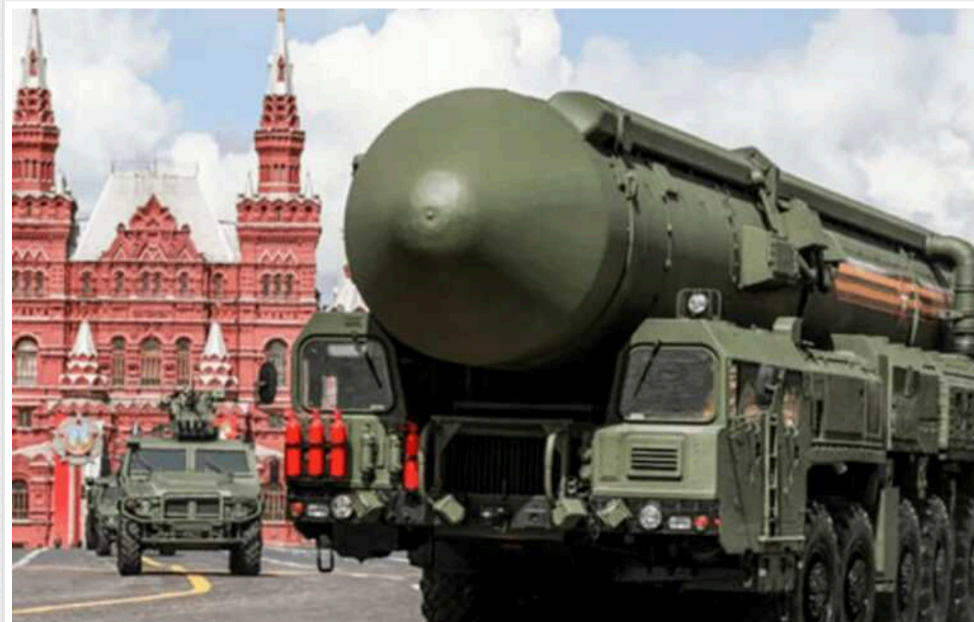
РФ може завдати ураження НАТО нестратегічною ядерною зброєю, – IISS

Росія може завдати удару нестратегічною ядерною зброєю, вважаючи на те, що НАТО не вистачить рішучості зробити відповідний крок, вважають експерти Міжнародного інституту стратегічних досліджень.