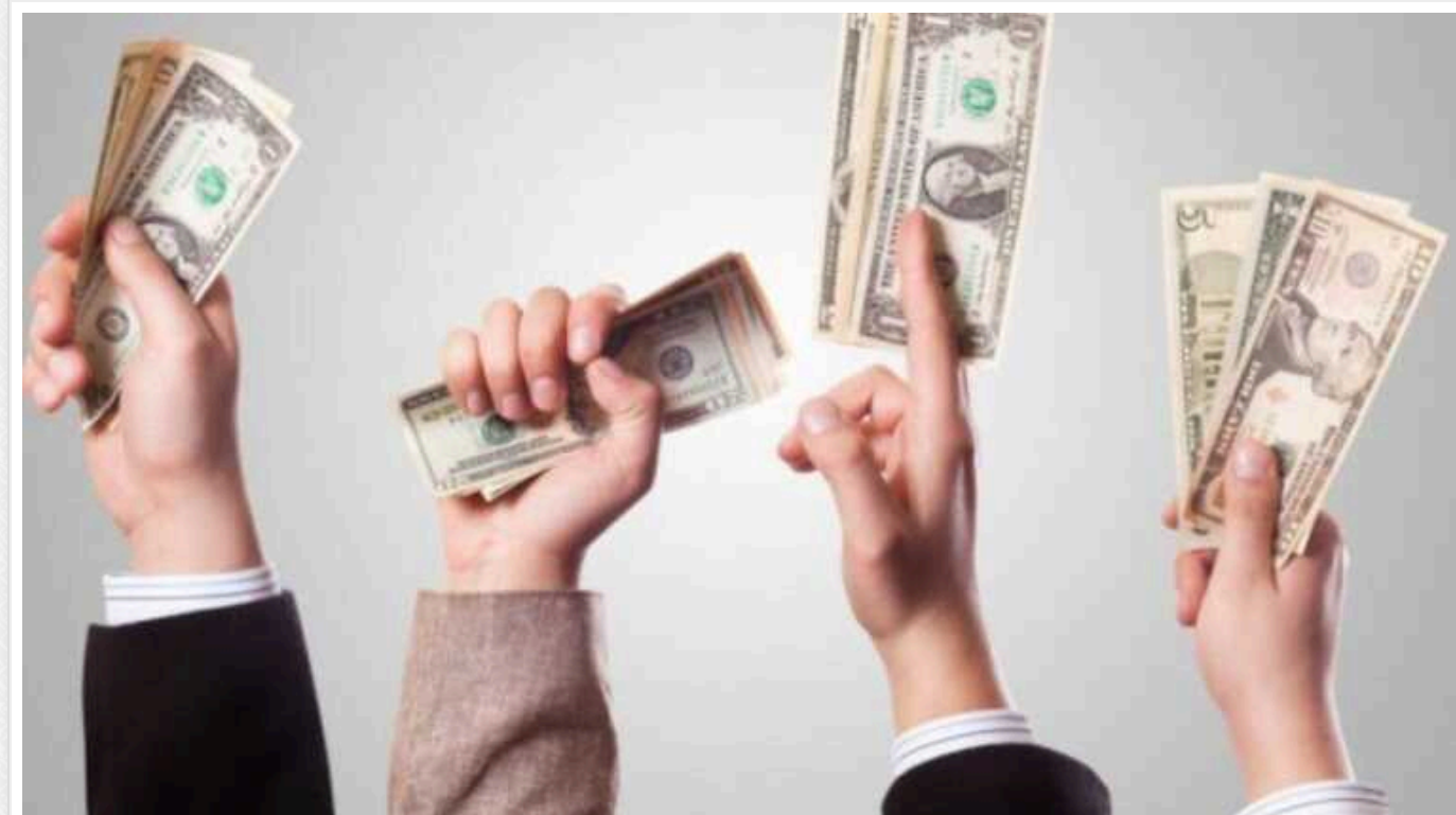
Приватбанк продасть 80 тисяч непрацюючих кредитів фізичних осіб

Державний "Приватбанк" виставив на торги в ДП "СЕТМ" права вимоги за портфелем кредитів на суму 501,4 млн грн. Сума є початковою ціною лоту.