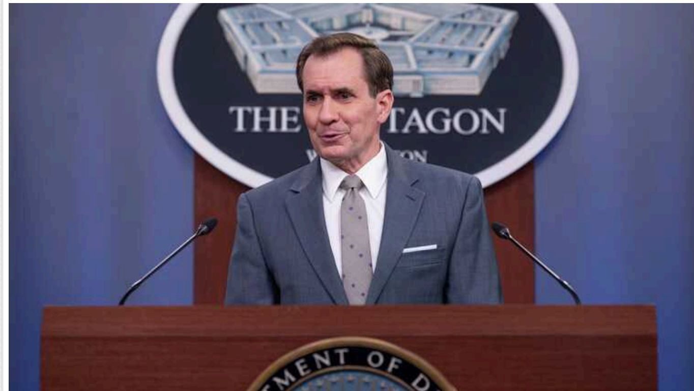
Відмова західних країн від підтримки України може бути катастрофічною для неї, - Кірбі

Координатор стратегічних комунікацій у Раді національної безпеки Джон Кірбі вважає "цілком можливим" відмову західних країн від підтримки України, якщо конгрес США не підтримає виділення нової допомоги Україні.