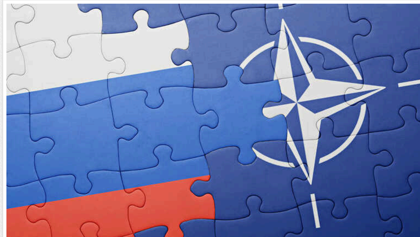
Видавництво The Daily Mail опублікувало «сценарій нападу РФ на НАТО»

Газета склала можливий план такого нападу з посиланням на колишнього командувача армії США Бена Годжеса та кількох військових експертів.