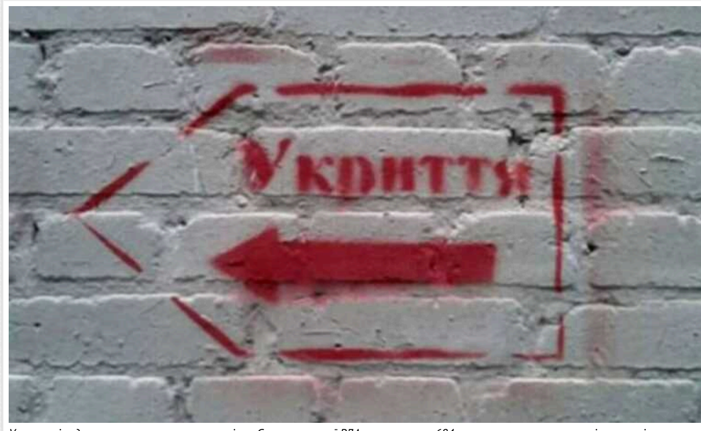
У столиці судитимуть начальника управління Святошинської РДА за розтрату 684 тисяч гривень на ремонті укриттів

Київською міською прокуратурою скеровано до суду обвинувальний акт відносно начальника Управління будівництва, архітектури та землекористування Святошинської РДА за фактом видачі завідомо неправдивих офіційних документів та розтрати бюджетних коштів під час капремонту укриття в Києві.