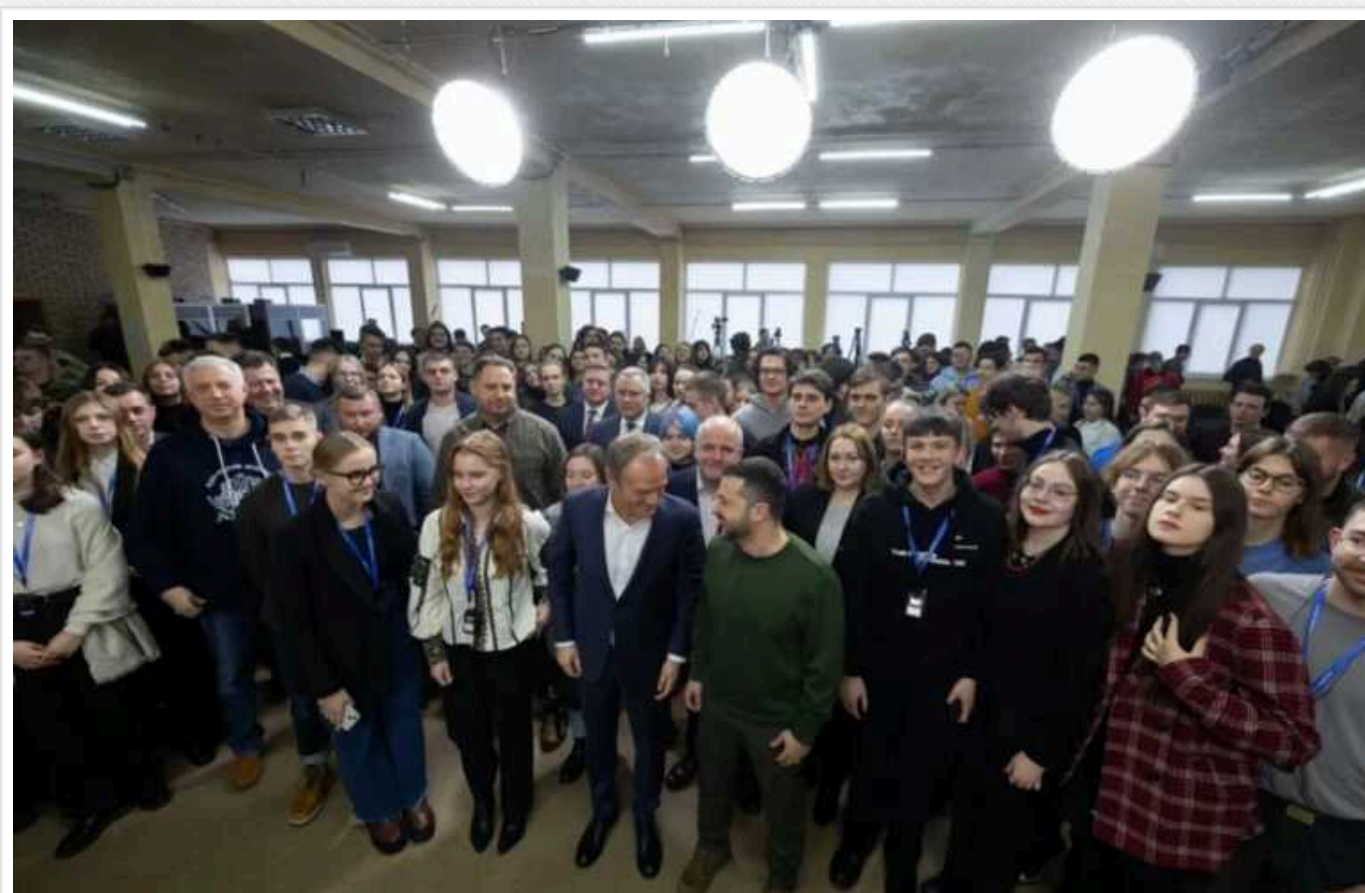
Туск та Зеленський зустрілися зі студентами українських ВИШів

Президент Володимир Зеленський разом із главою польського уряду Дональдом Туском провели зустріч з українськими студентами та викладачами кількох вишів. Зустріч відбулася у стінах Національного університету "Києво-Могилянська академія" в столиці 22 січня.