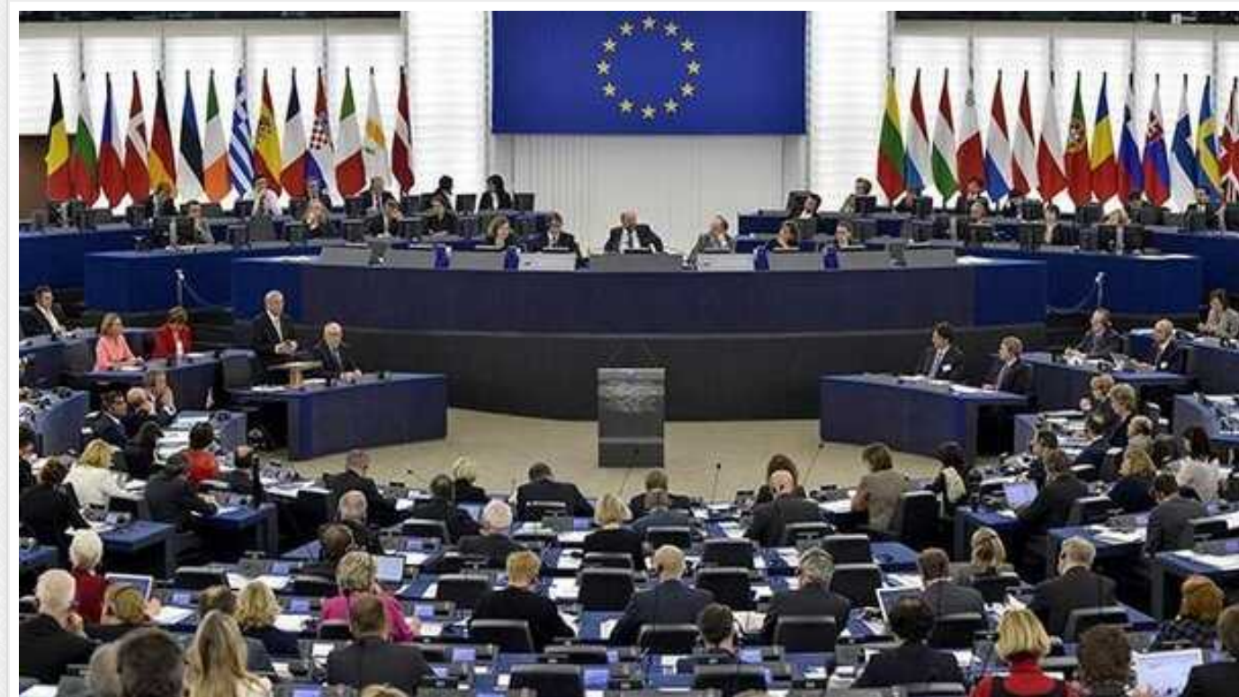
Угорщина може опинитись на межі виключення з Ради ЄС: Орбан вже отримав вагоме попередження

17 січня цього року депутати Європейського парламенту погодили проєкт резолюції щодо Угорщини, результатом якої має стати позбавлення Угорщини права голосу в Раді ЄС. І вже 18 січня Європарламент 345 голосами проти 104 ухвалив цю резолюцію із закликом до Ради ЄС активізувати сьому статтю проти Угорщини. Крім того, було ухвалено намір розпочати внутрішнє розслідування щодо рішення Європейської комісії про виділення 10 млрд євро для Будапешта.