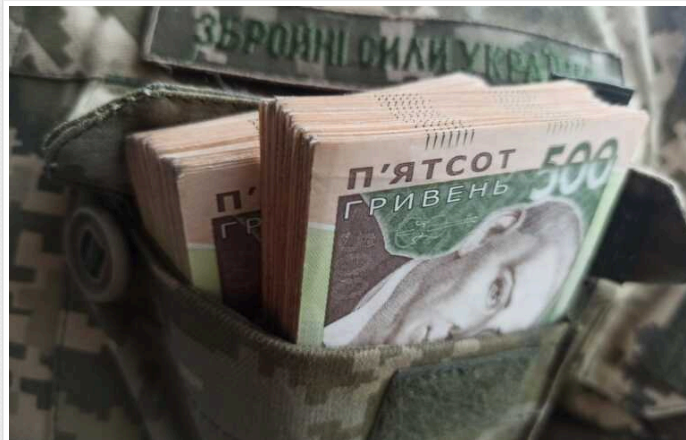
Україна у 2023 році витратила на оборону та безпеку понад 60% держбюджету, – Мінфін

За підсумками 2023 року видатки загального фонду держбюджету на сектор безпеки і оборони становили 1 843,8 млрд гривень або 60,8% від усієї суми видатків.