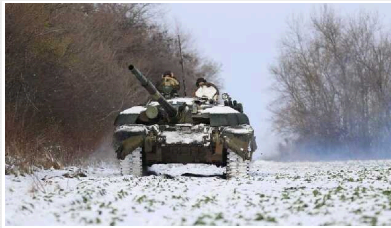
Ситуація на фронті: ЗСУ за добу відбили 47 атак на шести напрямках

Сили оборони України протягом доби відбили 47 ворожих атак на Куп'янському, Лиманському, Бахмутському, Авдіївському, Мар'їнському та Запорізькому напрямках, а також ще одну спробу штурму російських військ на лівому березі Дніпра.