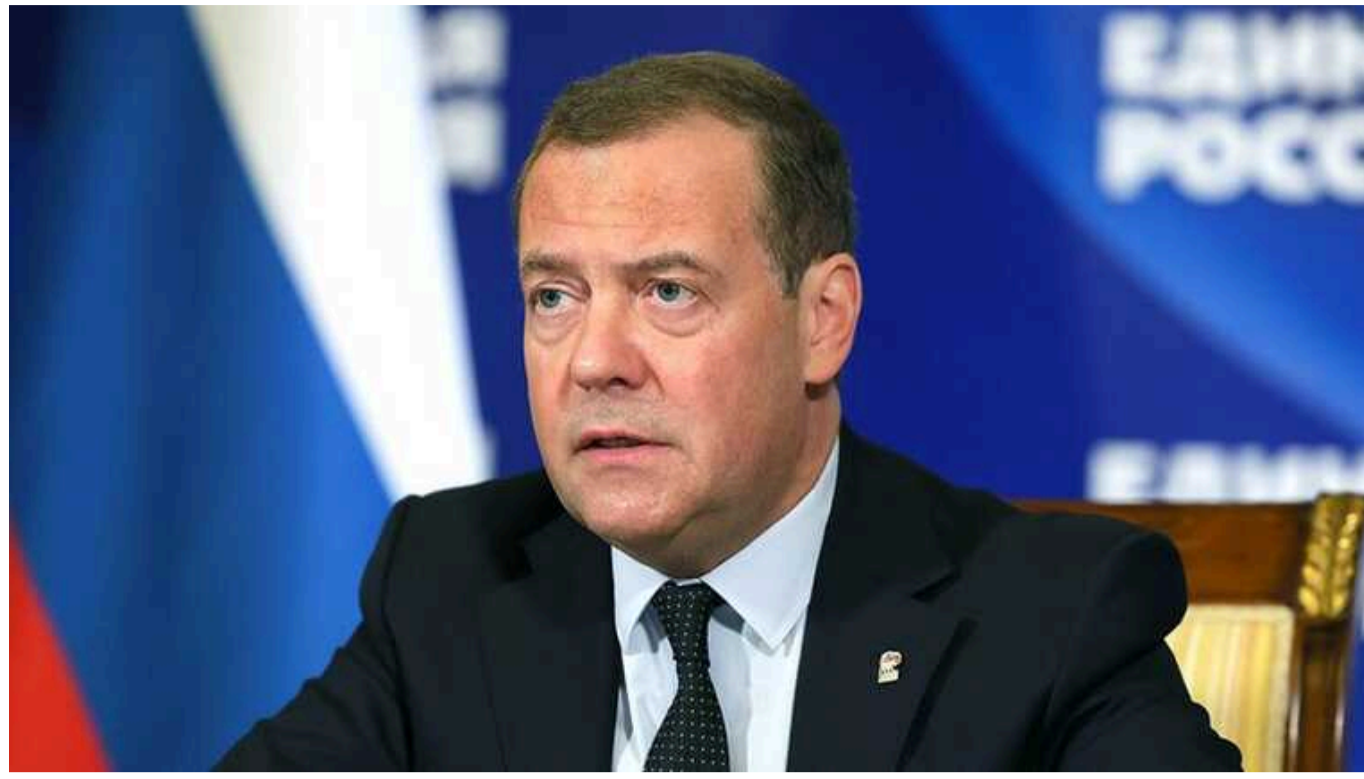
Медведев влаштував істеріку через указ Зеленського про історично населені українцями території РФ: "Українці – це росіяни"

Колишній президент Росії, а тепер заступник голови Ради безпеки Дмитро Медведев знову влаштував істеріку у мережі. Цього разу причиною чергового сплеску неадекватних заяв російського політика став указ президента України Володимир Зеленського про історично населені українцями території РФ.