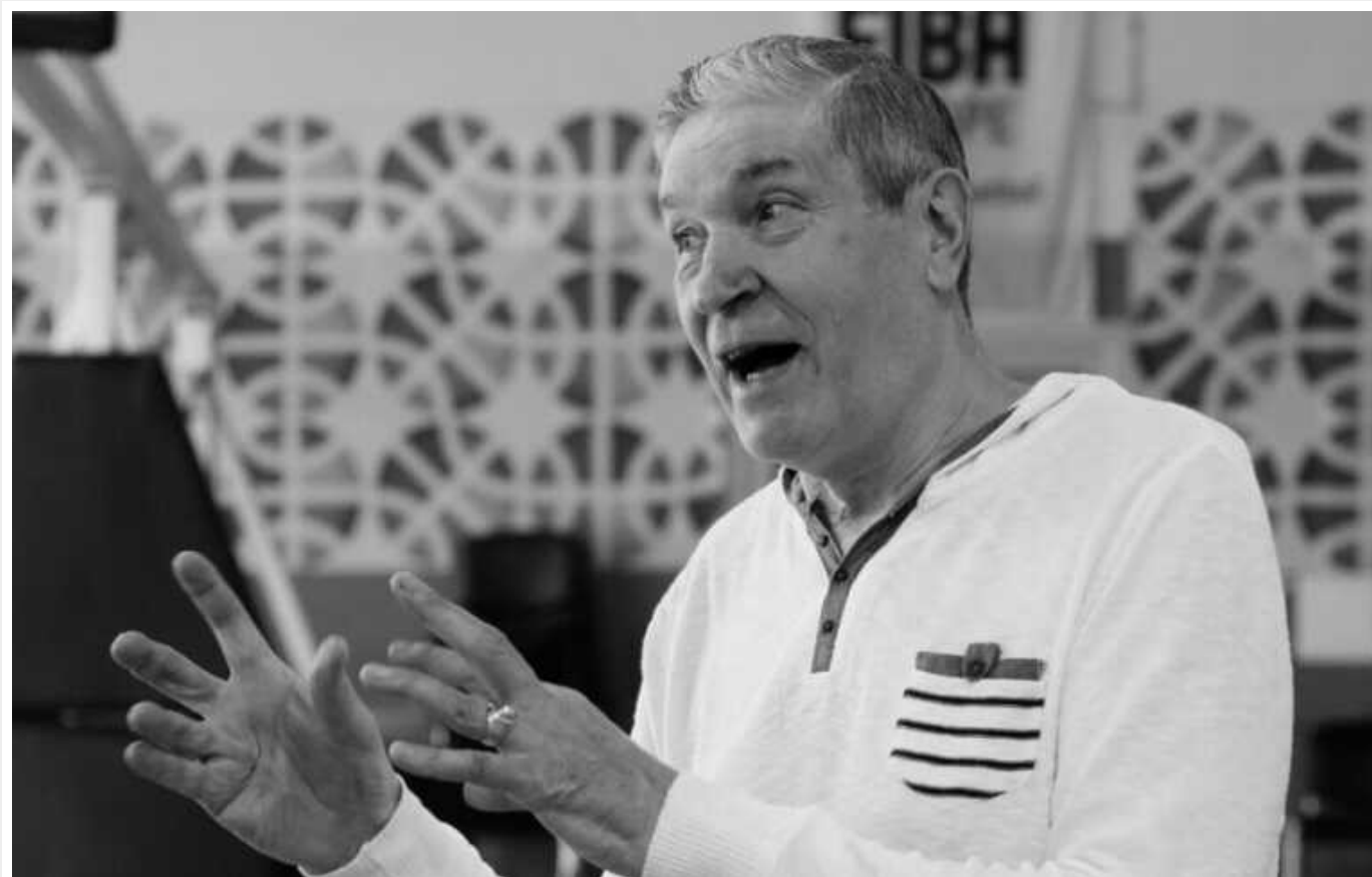
Помер український олімпійський чемпіон із баскетболу

Легендарний український баскетболіст Анатолій Поливода помер у понеділок, 22 січня. Олімпійському чемпіону Ігор-72 в Мюнхені було 76 років.