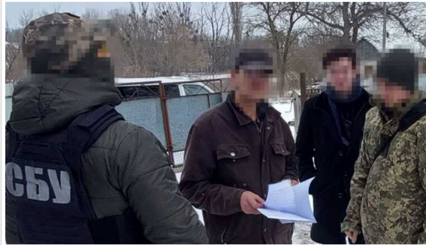
СБУ затримала ворожих агітаторів: використовували інтернет-ресурси для поширення фейків

Одну любительку "руського миру" затримали на Київщині. Кіберфахівці Служби безпеки викрили жінку, яка з власних акаунтів у Facebook та Telegram агітувала українців "скласти зброю" і не чинити опір російським окупантам.