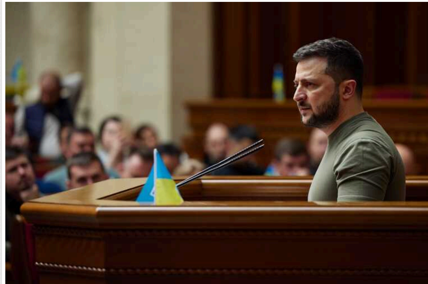
У Верховній Раді зареєстрували законопроект Зеленського про множинне громадянство

У парламенті України сьогодні, 22 січня, зареєстрували проект закону президента Володимира Зеленського про множинне громадянство.