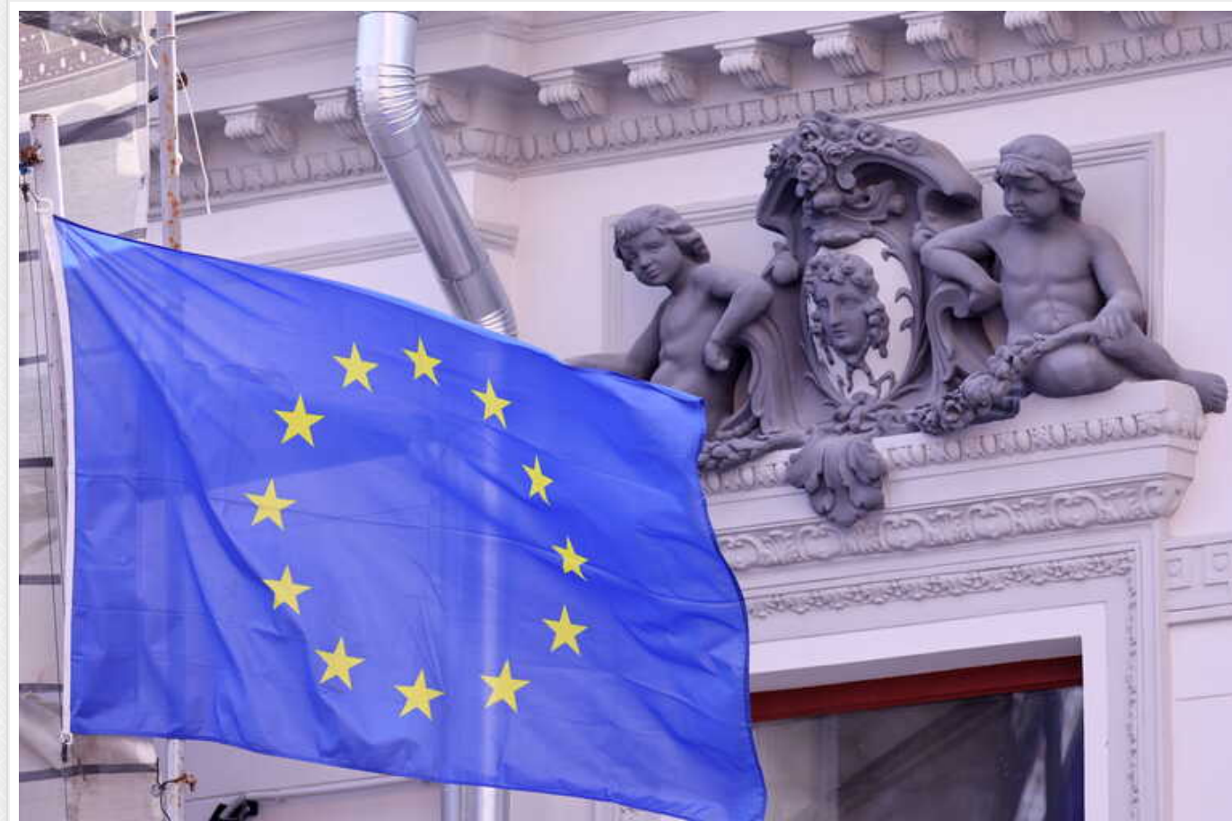
Боррель заявив, що країни Євросоюзу погодили використання заморожених російських активів

Глава зовнішньополітичного відомства Євросоюзу Жозеп Боррель заявив, що між країнами-членами ЄС існує політична згода щодо використання надходжень від заморожених російських активів.