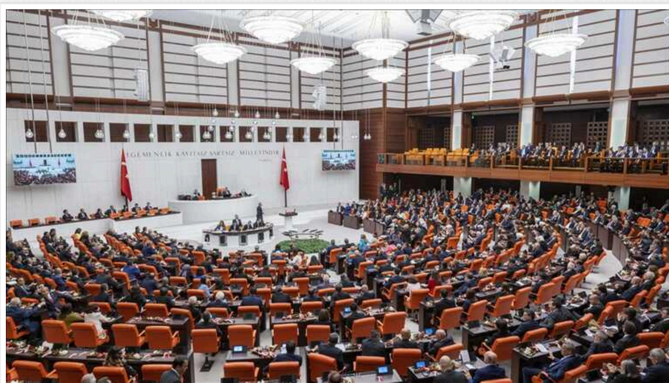
Парламент Туреччини розгляне вступ Швеції до НАТО, - CNN

У парламент Туреччини у вівторок внесуть до розгляду питання ратифікації заявки Швеції на вступ до НАТО.