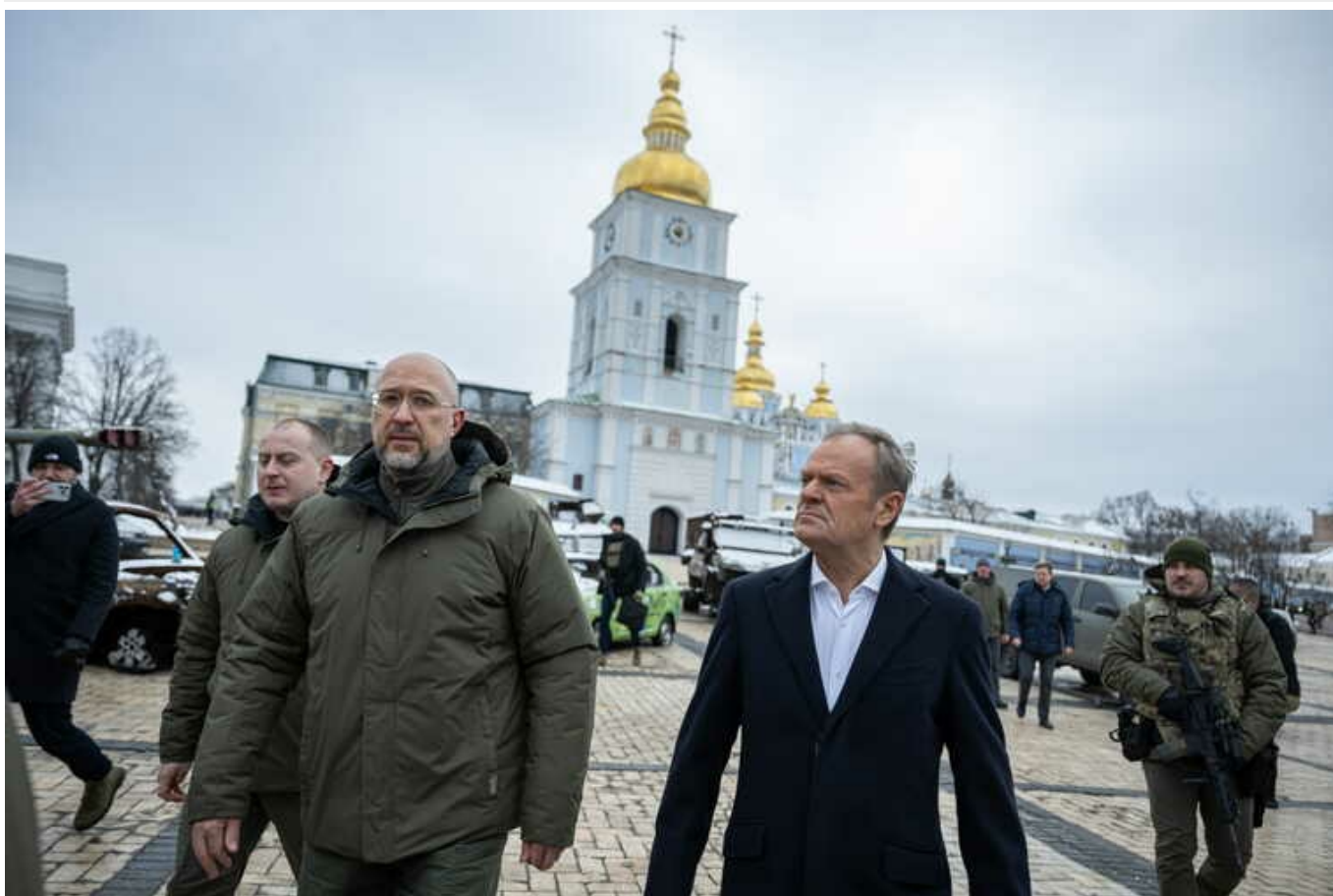
Туск і Шмигаль обговорили створення чотирьох нових контрольних-пропускних пунктів на кордоні України та Польщі

Прем'єр-міністр України Денис Шмигаль повідомив, що обговорив зі своїм польським колегою Дональдом Туском створення чотирьох нових пунктів пропуску на спільному кордоні.