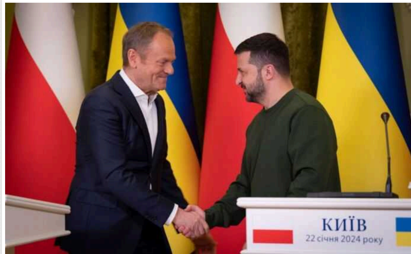
Польща та Україна знайдуть вигідний для сільгоспвиробників обох країн вихід, - Туск

Прем'єр-міністр Польщі Дональд Туск розповів про дії Варшави та Києва для вигідної діяльності сільгоспвиробників і перевізників обох країн.