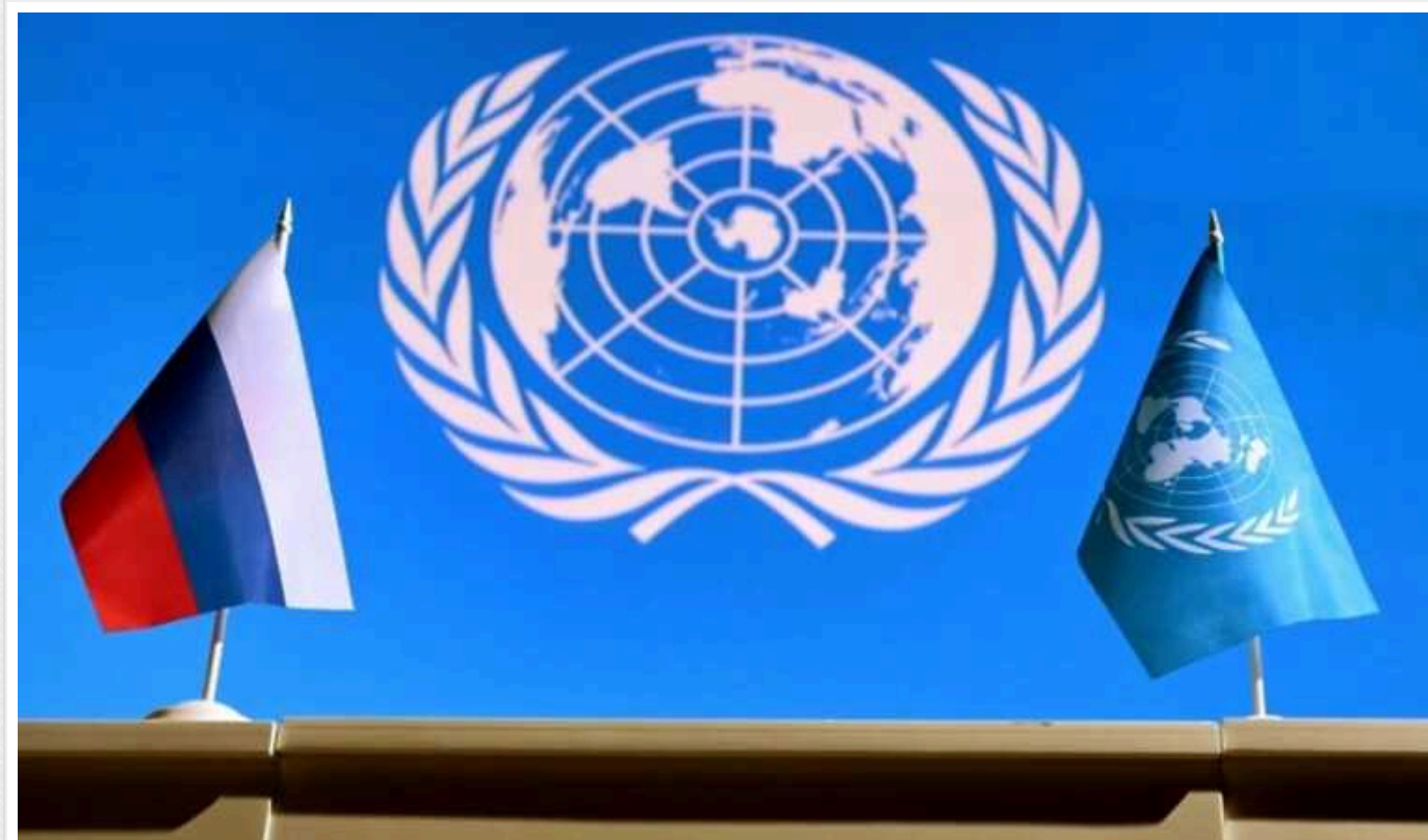
Reuters: ООН відкрила у російському банку рахунок і вперше почала приймати платежі в рублях

Організація об'єднаних націй відкрила рахунок у непідсанкційному російському банку і вперше почала приймати платежі в рублях.