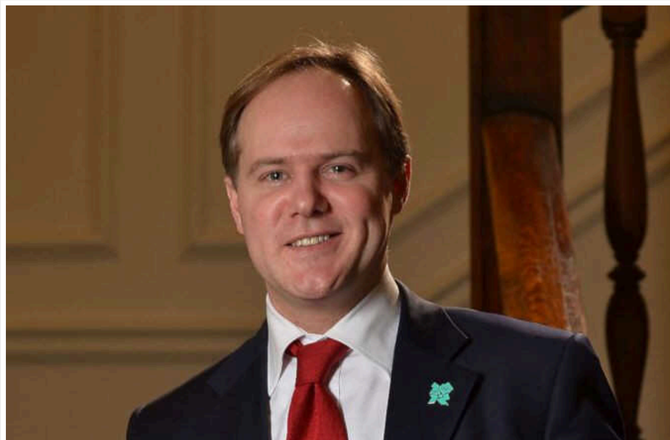
Ми готові, що нашою зброєю переможуть РФ, - Посол Британії

Посол Британії в Україні Мартін Гарріс відповів, чи є в Україні дозвіл Лондона бити по РФ британською зброєю. За його словами, Британія готова до того, що її зброя буде складовою поразки Росії.