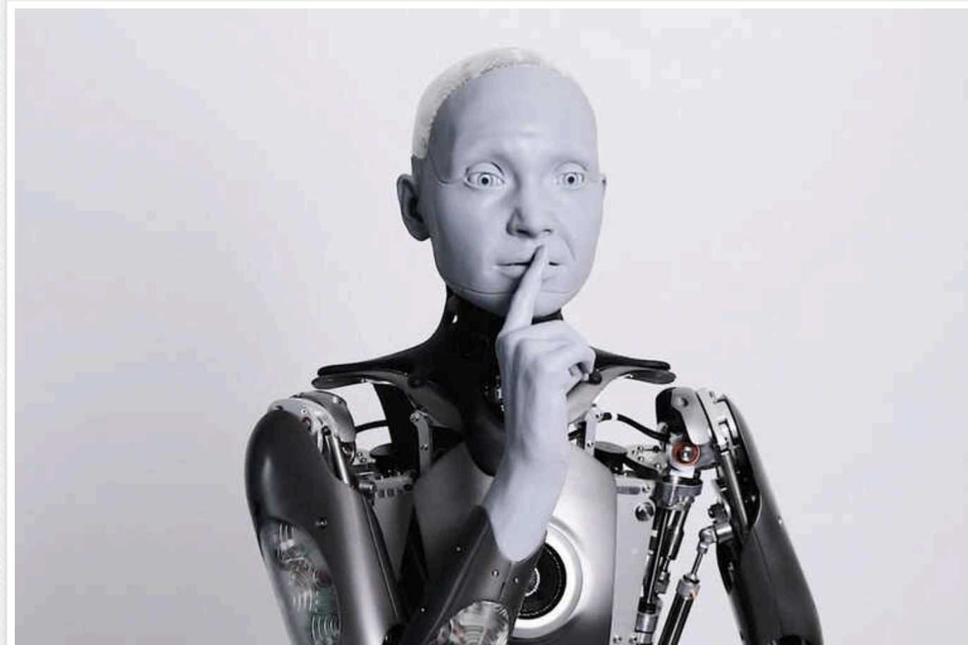
Через 15-20 років у світі може з'явитися вже мільярд роботів-гуманоїдів, - Ілон Маск

Засновник лабораторії дослідження II Девід Хольц написав: