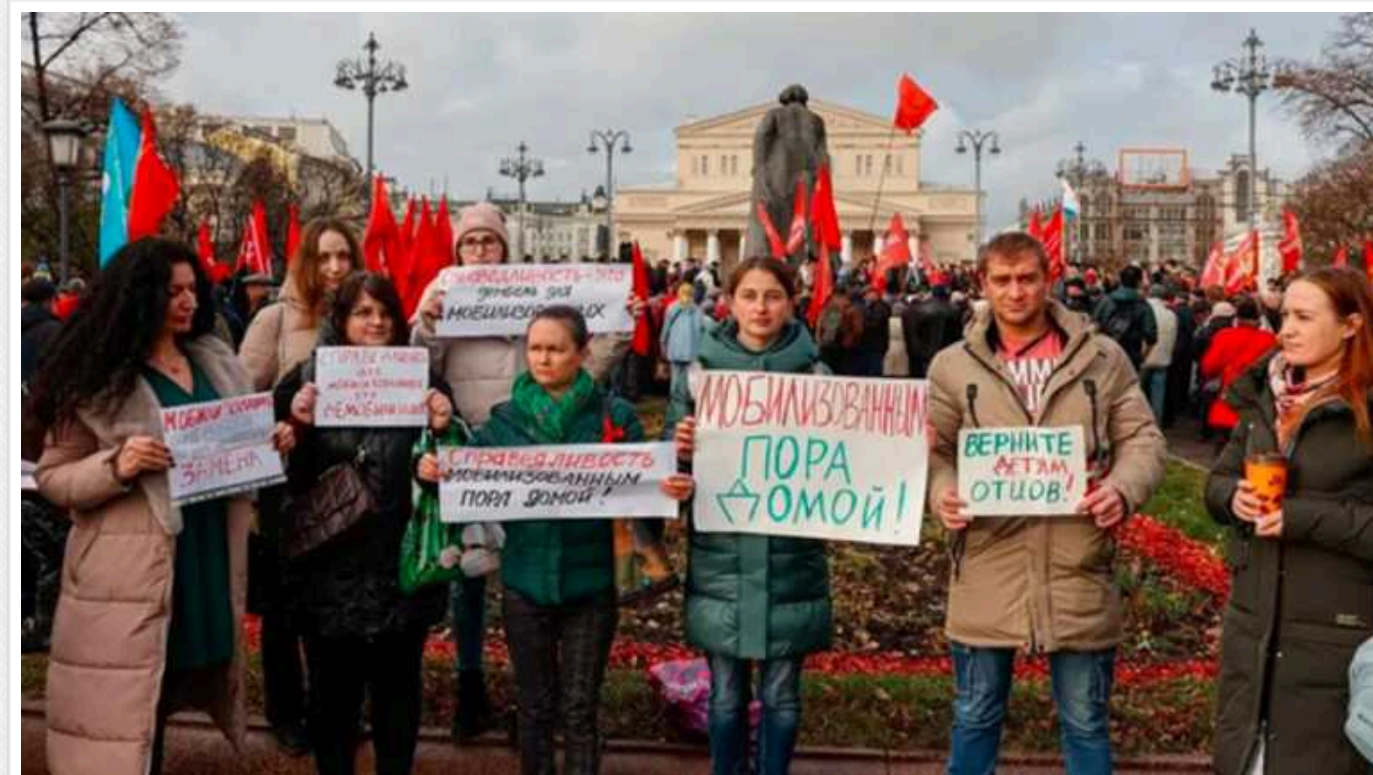
Розгнівані дружини кажуть Путіну: поверніть наших чоловіків із України, - The Times

Антивоєнні протести, очолювані дружинами мобілізованих російських військовослужбовців, все частіше стають "скалкою у дупі" для Кремля, пише The Times.