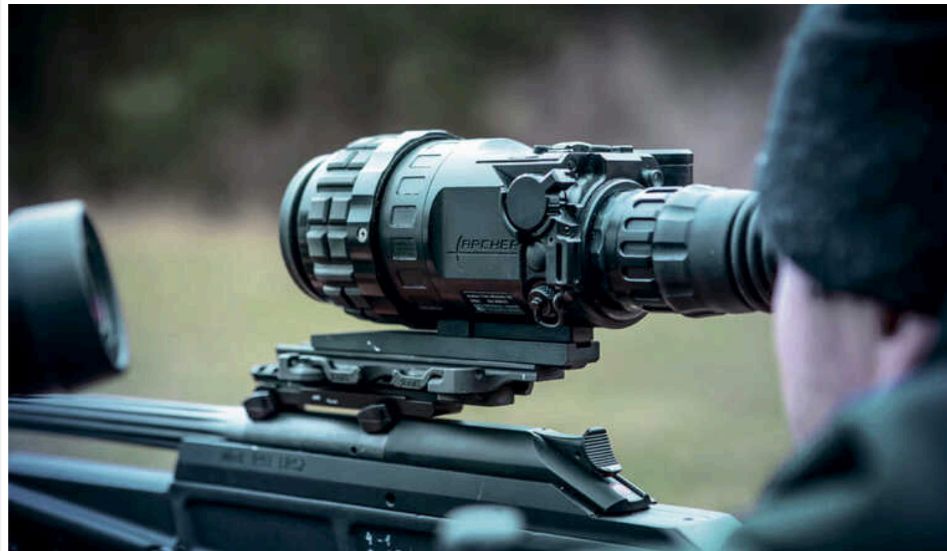
Два снайпери ГУР МО знешкодили 22 ворогів за одну ніч за допомогою прицілів "Archer" - деталі

Два снайпери Головного управління розвідки Міністерства оборони України за одну ніч вразили 22 російських солдати, вони користувались зокрема тепловізійними прицілами "Archer".